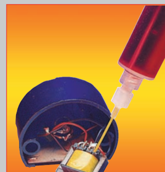
DOSITOP Accessoires de dosage pneumatique