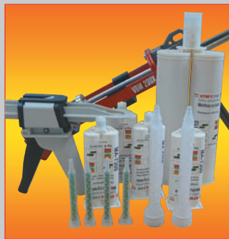
STRUCTOP Colles structurales