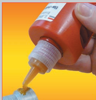
LOCKTOP Résines anaérobies