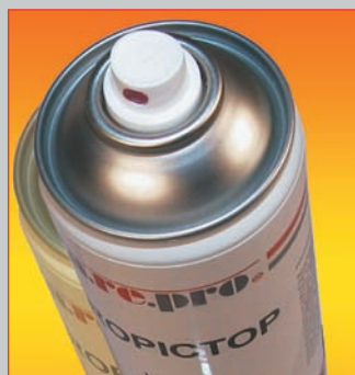
TECHNITOP Aérosols techniques